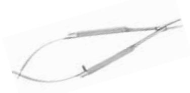
Augennadelhalter nach Barraquer