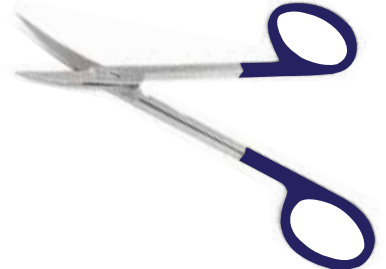
Chirurgische Schere, MicroCut, Gebogen