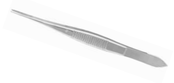
Irispinzette nach Graefe, Gebogen