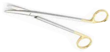
Chirurgische Schere nach Metzenbaum, TC