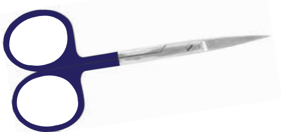
Chirurgische Schere, MicroCut, Gerade