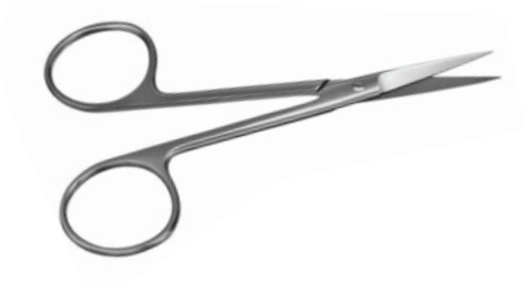
Feine Chirurgischeschere, Gerade