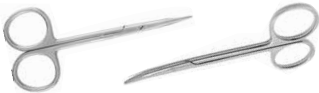
Tenotomieschere nach Stevens