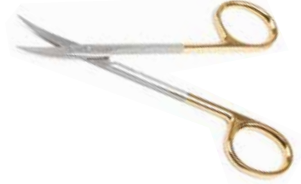
Feine Chirurgischeschere, Gebogen, TC