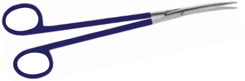
Chirurgische Schere nach Metzenbaum MicroCut