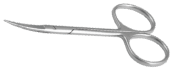
Feine Chirurgischeschere, Gebogen