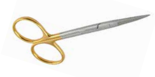
Feine Chirurgischeschere, Gerade, TC