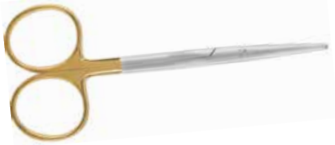
Chirurgische Schere nach Metzenbaum, TC