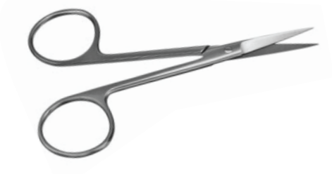
Feine Chirurgischeschere, Gerade